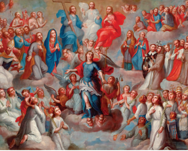
Jóse de Páez, The Glory of Heaven , 1771–72. Mission San Carlos Borromeo, Diocese of Monterey, Calif.

y decenas de soldados, se aventuró hacia el norte desde Baja California y fundó la Misión de San Diego en el verano de 1769. Un año después, Fray Junípero fundaba una misión en Monterey y, junto con Gaspar de Portolá, el líder militar en California, tomó posesión de Alta California en nombre de España.